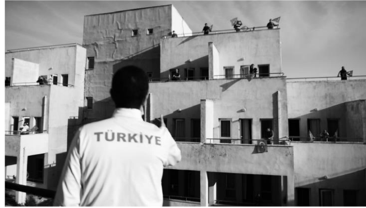
Suudi Arabistan'dan getirilen 336 Türk vatandaşı, Malatya'daki yurttaki karantina sürecinin tamamlanmasından sonra evlerine uğurlandı. Mardin'de yurttaki kalan vatandaşlar da sunulan hizmetten dolayı teşekkür etti.

Öğrenci yurtlarında 62 bin vatandaş misafir ettiklerini açıklayan Bakan Kasapoğlu, "Dünyanın en büyük otel zincirlerini aratmayan bir hizmeti sunuyoruz. Bu zor süreçte öğrenci yurtlarımız , sadece gençlerimizin değil, bütün milletimizin yurdu, yuvası olmuştur" dedi.