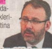
Mehmet Muharrem Kasapoğlu

■ GENÇLİK ve Spor Bakanı Mehmet Muharrem Kasapoğlu, bugüne kadar Kredi Yurtları Kurumu bünyesindeki yurtlarda toplamda 62 bin 166 vatandaşa ev sahipliği yapıldığını duyurdu. Şu anda 76 ilde bulunan 169 bakanlık yurdunda toplam 28 bin 916 vatandaşı da misafir etmeye devam ettiklerini ifade eden Kasapoğlu, karantina süreçlerini tamamlayan 33 bin 250 vatandaşı ise evlerine uğurladıklarını söyledi.