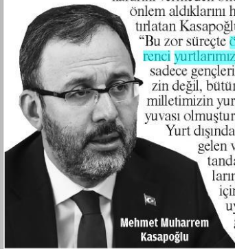
Mehmet Muharrem Kasapoğlu

Bakan Kasapoğlu, salgınla mücadele sürecinde Türkiye'nin en etkili tedbirleri ile ivedilikle hayata geçirdiğini ve en nitelikli mücadeleyi ortaya koyduğunu dile getirdi. Dünya Sağlık Örgütü'nün pandemi kararını vermeden önce önlem aldıklarını hatırlatan Kasapoğlu, "Bu zor süreçte öğrenci yurtlarımız , sadece gençlerimizin değil, bütün milletimizin yurdu, yuvası olmuştur. Yurt dışından gelen vatandaşlarımız için uygula-