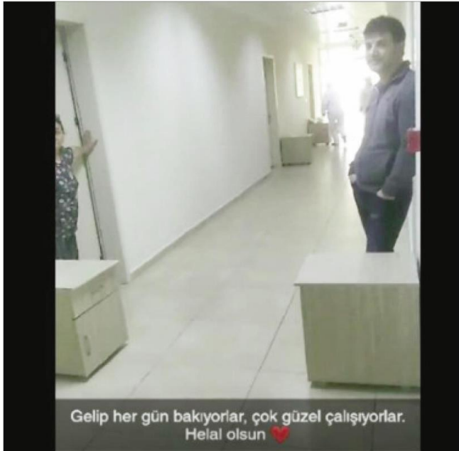
Gelip her gün bakıyorlar, çok güzel çalışıyorlar. Helal olsun ❤️