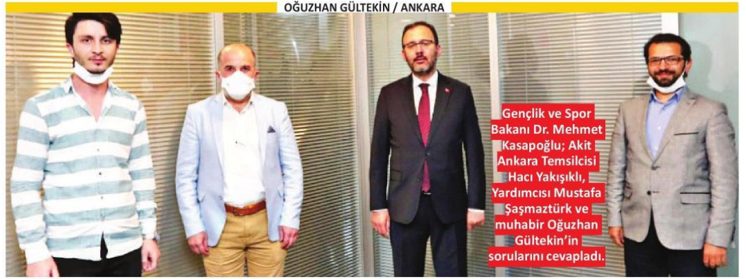
OĞUZHAN GÜLTEKİN / ANKARA

Gençlik ve Spor Bakanı Mehmet Muharrem Kasapoğlu, Akit'e salgın sürecinde bakanlığının üstlendiği rolü anlattı. Kasapoğlu, "700 bin yataklı yurtlarımızda dünyanın en büyük otel zincirlerinde olabilecek konfor ve hizmeti verdik. 62 bin 710 vatandaş yurtlara giriş yaptı. Bırakın vatandaşına sahip çıkmayı, halkına maske ve eldiven bile dağıtmayan ülkelerin insanlarına da kapılarımızı açtık" dedi. Kasapoğlu, bu süreçten Türk sporunun da güçlenerek çıkacağını söyledi.